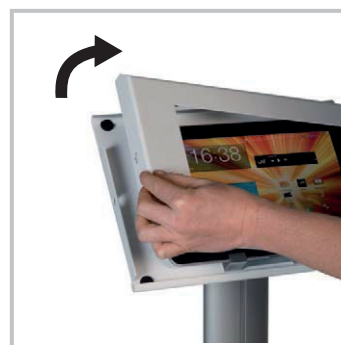
Accès sécurisé et instantané