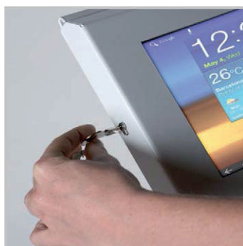
Verrouillage par clef