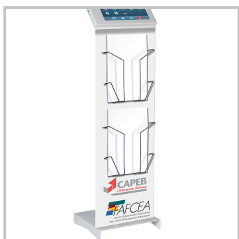
Option bacs documents

En option : Impression sur support rigide - partie basse - partie supérieure