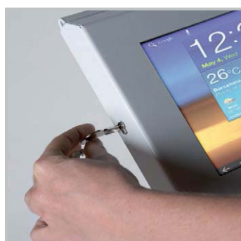
Verrouillage par clé