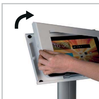
Accès sécurisé et instantané